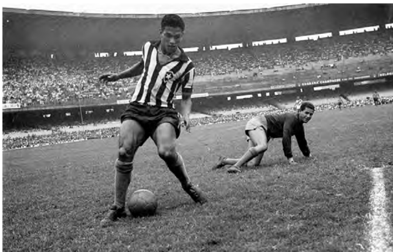
Garrincha, ambe lei colors de Botafogo

Ambe la democratizacion dau fotbòl puei de la television, lo dribble venguèt puslèu un biais d'amuser leis espectadors. Lo primier que popularizèt lo dribble fuguèt Garrincha. Aquel amerindian èra gòl amb una gamba mai granda que l'autra de sièis centimètes. Es gràcia a aquela mau-formacion que l'internacionau brasilián fasiá virar la bala en sosprenent sovent son adversari. D'autrei, dempuei, an practicat lo dribble ambe talent. Pelé e Maradona an participat fòrça