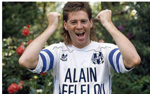
Chris «Magic» Waddle

Dribble, en anglés, vòu dire literalament tombar gota per gota e per extension passar lo balon en lo contrarotlar ambé lo pè. Aquò's pas nòu, coneissem de vielhas referéncias au dribble dins leis espòrts de l'Edat-Mejana. Lo poèta anglés dau sègle XIV, Geoffrey Chaucer, faguèt la descripcion d'una accion de juec de son epòca ambe lei mòts següents: "rodelat sota lo pè coma una bala".