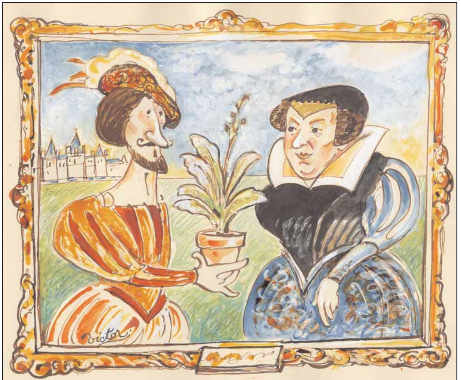
— Jan Nicot pourgis la planto de taba à Catarino de Médicis —