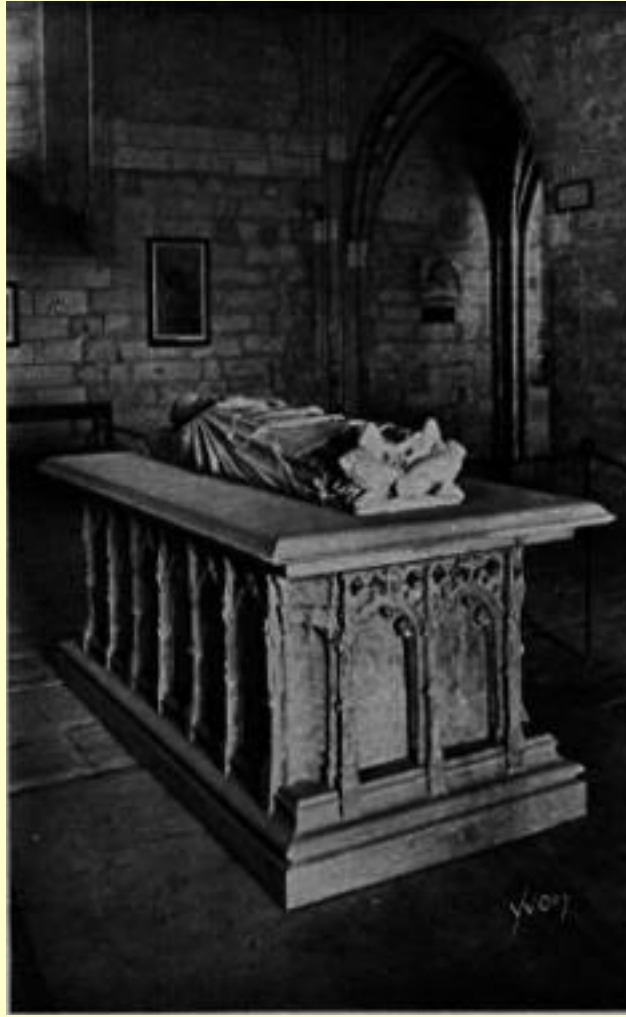
Le Tombeau de Clément VI