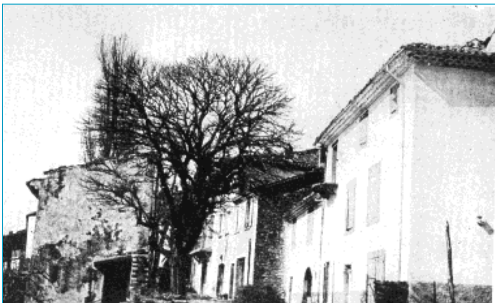
Maison natale de l'abbé Pascal à l'Epine.