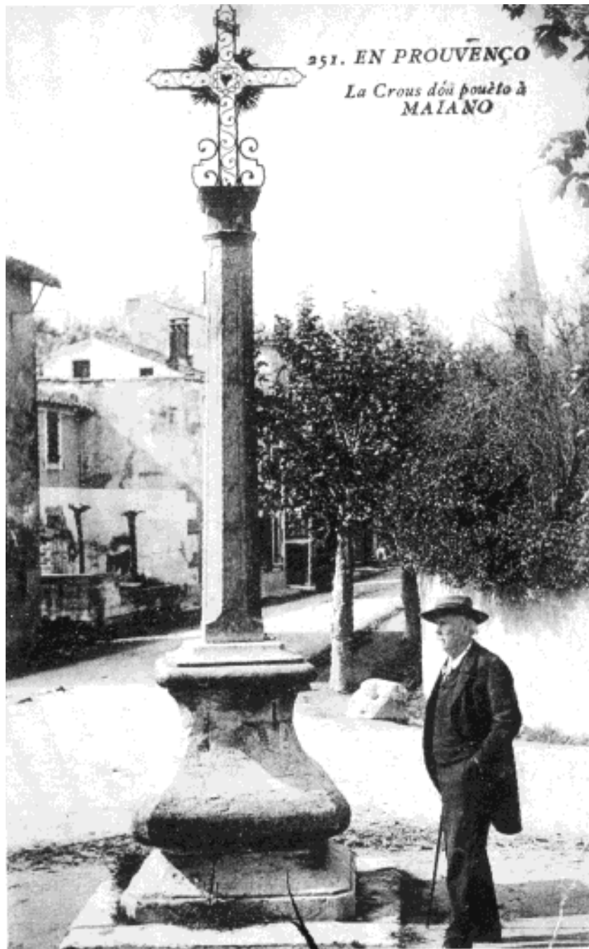
Croix de Maillane