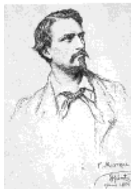
Frédéric Mistral Portrait par Hébert.

Le provençal haut-alpin, la Société d'Etudes des Hautes-Alpes et «l'Escolo de la Mountagno» (1881-1981) 1982 (Société d'Etudes des Hautes-Alpes)