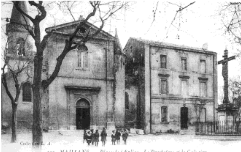
Eglise et clocher de Maillane.