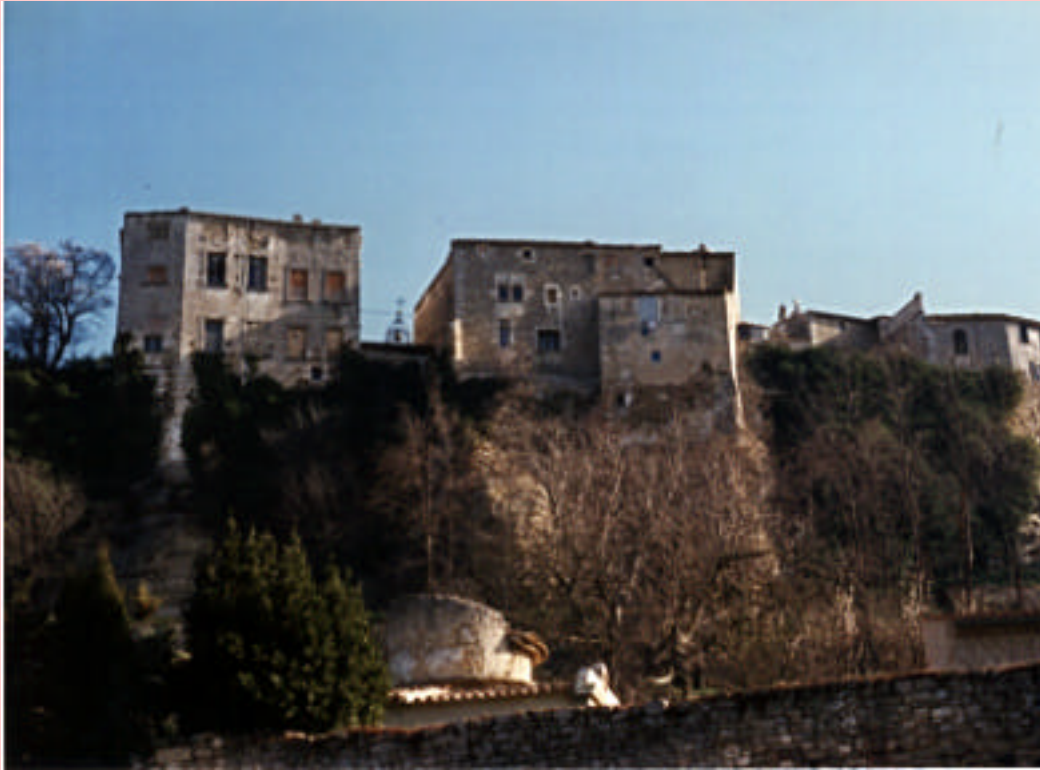
Visto de Menerbo

Aqueste moulin, lou Castelet, es estraordinàri: