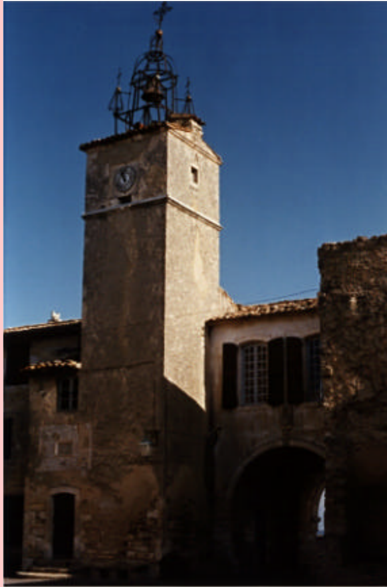
Lou clouchié de Menerbo

Lou 3 de novèmbre de 1851, lou pichot Clouvis nais à Menerbo, pichot vilajoun de la Vau-Cluso, perdu sus l'Uba dóu Leberoun.